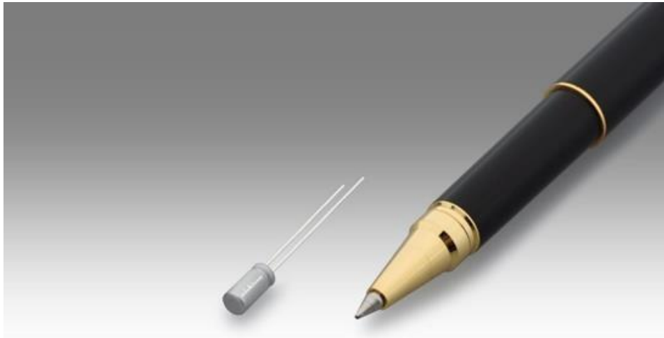
图 3 小型锂离子可充电电池“SLB 系列”