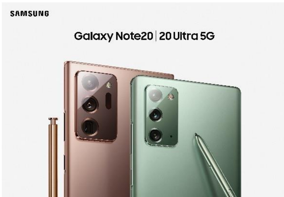
图 2 Galaxy Note20 和 Galaxy Note20 Ultra